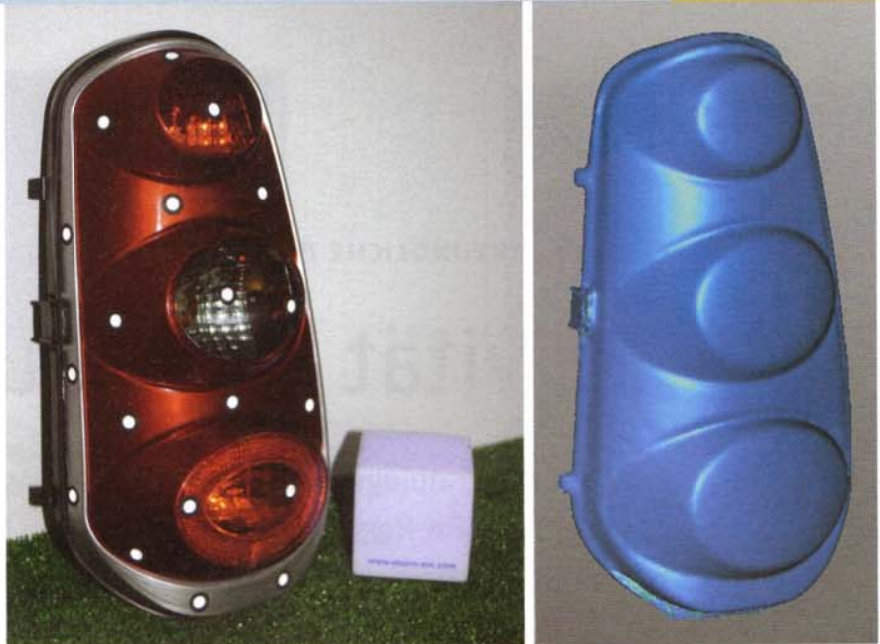
Original und Rekonstruktion: links im Bild das Original-Teil; rechts im Bild die in Echtzeit generierten Objektdaten, die sich in alle gängigen CAD-Systeme übertragen lassen.

In der Vergangenheit wurde das Reverse Engineering jedoch oft nur von der