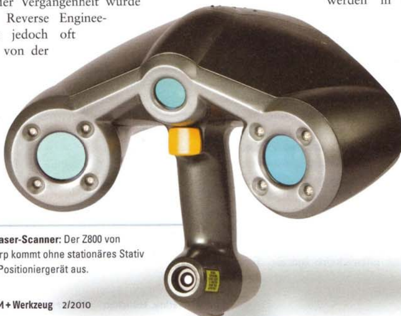
3D-Laser-Scanner: Der Z800 von Z-Corp kommt ohne stationäres Stativ und Positioniergerät aus.

Mit den selbstpositionierenden 3D-Laser-Scannern von Z-Corporation halten dagegen Geschwindigkeit, Benutzerfreundlichkeit und Vielseitigkeit im Bereich des 3D-Scannens Einzug. Mit diesen 3D-Scannern lassen sich Objekte auch auf engstem Raum in Echtzeit mit einem kontinuierlich durchgeführten Scan erfassen. Die 3D-Laser-Scanner Z600, Z700, Z700 CX, Z700 PX und Z800 von Z-Corporation bieten damit Schnelligkeit, Einfachheit, Flexibilität und Präzision in einem Paket. ■